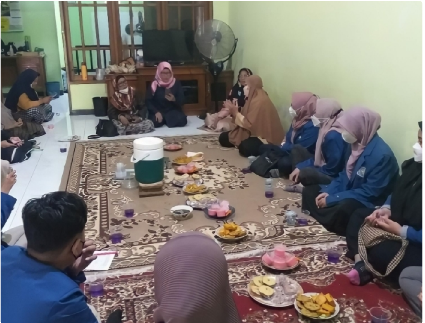
Kegiatan pendampingan dan transfer ilmu oleh tim KKN Abmas ITS kepada UMKM setempat

SURABAYA – Harga minyak goreng yang tengah membumbung tinggi di pasaran membuat sebagian pejuang ekonomi keluarga merasa terhimpit dan kewalahan. Berangkat dari permasalahan tersebut, tim Kuliah Kerja Nyata dan Pengabdian Masyarakat (KKN Abmas) Institut Teknologi Sepuluh Nopember (ITS) melakukan sosialisasi hingga pendampingan tentang proses penjernihan