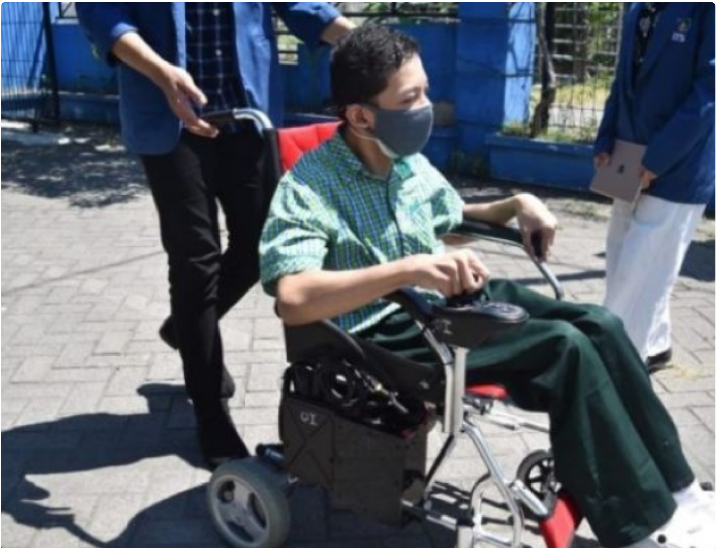
Kursi roda elektrik untuk disabilitas karya mahasiswa Departemen Teknik Biomedik ITS

SURABAYA – Peminatan Teknologi Asistif dan Rehabilitasi Medika merupakan satu dari empat bidang peminatan unggulan di Departemen Teknik Biomedik Institut Teknologi Sepuluh Nopember (ITS). Bidang ilmu ini berfokus pada teknologi medis yang mampu mendukung aktivitas para penyandang disabilitas